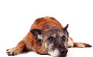
B. Ulysse souffre du syndrome de l'abandon