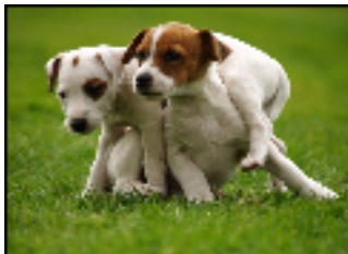
A. Filou et Fripouille, 2 chiots en pleine croissance

Relier les 4 dog sitters aux chiens qui leur correspondent !